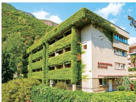
Blindenzentrum St. Raphael

allem um die religiöse und kulturelle Betreuung der deutschsprachigen blinden und sehbehinderten Menschen in Südtirol. Ihr Wunsch nach einem Heim für Blinde und Sehbehinderte, einer Ausbildungsstätte und einem Treffpunkt für alle Sehbehinderten und Blinden Südtirols erfüllt sich durch das Geschenk eines Grundstücks in Gries. 1976 erfolgt die Grundsteinlegung, 1979 ziehen die ersten Heimbewohner ein und am 26. April 1980 wird das Blindenzentrum St. Raphael offiziell eingeweiht.