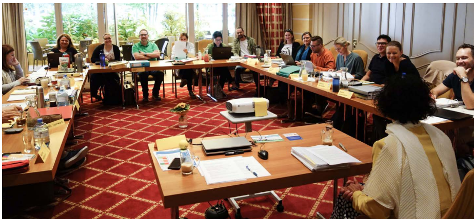
Lerngang im Jahr 2019

Seit Herbst 2020 verfügen unsere TrainerInnen und TeilnehmerInnen über die nötige IT-Ausstattung samt digitaler Methodenkompetenz für Online-Seminare, im Fachbegriff „Distance learning“. Seit November 2020 bzw. dem zweiten Lockdown gestaltet das IBG die Online-Seminare „präsenzhähnlich“ und bindet die TeilnehmerInnen interaktiv ein. Die Evaluierungen der Seminare werden online durchgeführt und weisen eine große Zufriedenheit mit dem Distance learning aus, aber auch Verbesserungspotentiale werden aufgezeigt. Rückblickend wurden die Herausforderungen mit Kreativität, viel Engagement im IBG-Team und Empathie für die Situationen der TeilnehmerInnen gemeistert. Trotzdem wünschen wir uns wieder Seminare in Präsenz und ein Leben mit realen Begegnungen, menschlicher Nähe und einem lebendigen Erfahrungsaustausch.