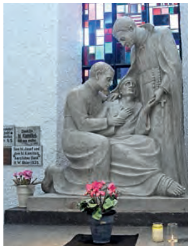
Der hl. Kamillus mit einem Ordensbruder und einem Kranken. Gruppe aus Alabaster; Bildhauer Franz Koch.

Vieles, was Kamillus für die Armen und Kranken tut, lässt ihn zu einem barmherzigen Samariter werden. Er richtet seinen Blick auf Jesus. Dessen Botschaft von der Liebe zu Gott und zum Mitmenschen wird ihm zur Richtschnur seines Lebens. Diesen Jesus hat er im Blick, ihm will er folgen, nicht in frommer