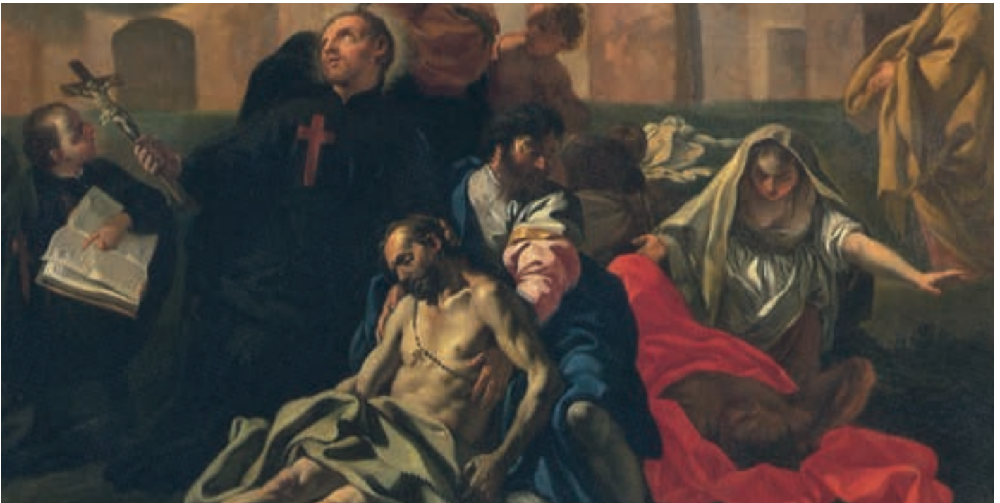
Kamillus pflegt die Pestkranken, Gemälde von Andrea del Pozzo, Vatikanische Museen