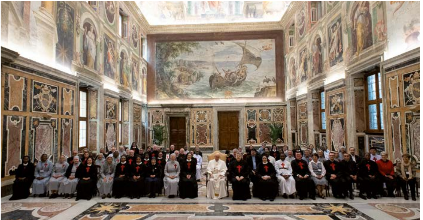
72 Vertreterinnen und Vertreter der Familie des kamillianischen Charismas bei der Audienz mit Papst Franziskus